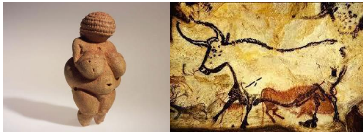
Venere di Willendorf e pittura rupestre.