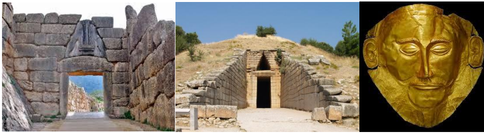
Porta dei Leoni, Micene.