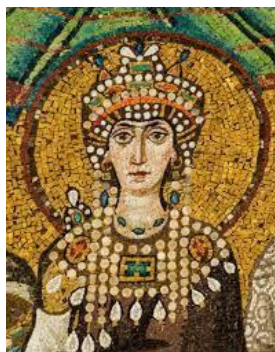
Mosaico di Teodora, Ravenna