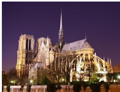
Notre Dame, Parigi